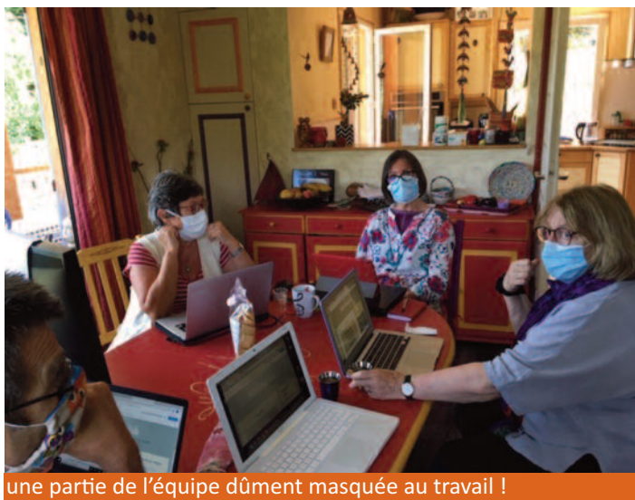
une partie de l'équipe dûment masquée au travail !